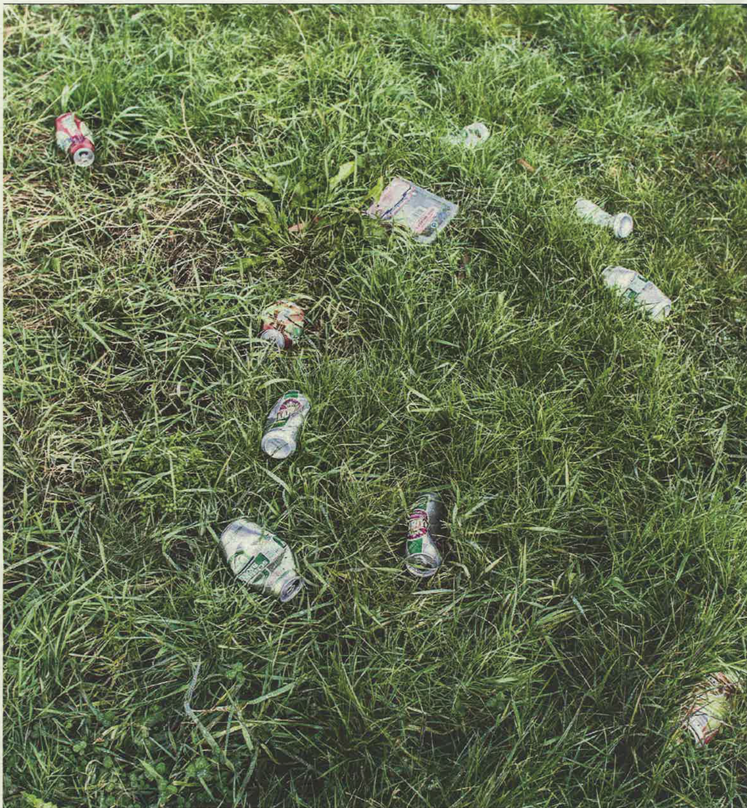
Rommel in de berm langs de snelweg.